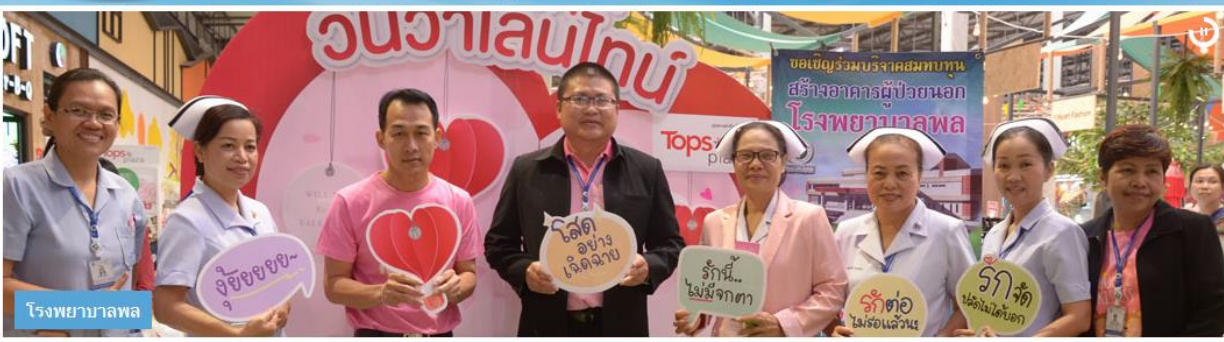
โรงพยาบาลฟล ๐๐๐๐