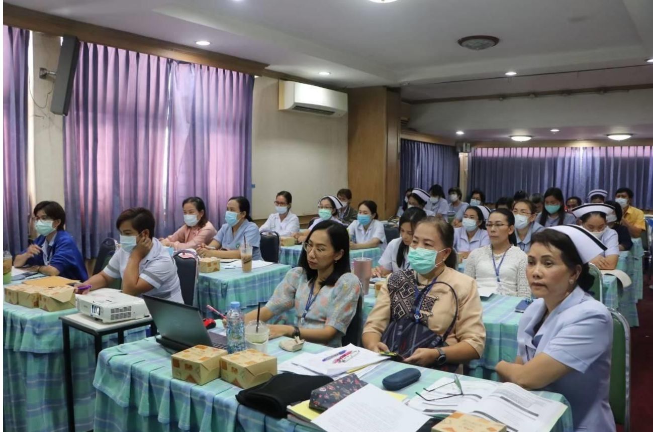
ภาพการบรรยายให้ความรู้เรื่องการป้องกันผลประโยชน์ทับซ้อนในหน่วยงาน ภาพประกอบ : การอบรมความรู้บุคลากรเจ้าหน้าที่ห้องประชุมโรงพยาบาลพล ความรู้การป้องกันผลประโยชน์ทับซ้อน จิตพอเพียงต้านทุจริต วันที่ ๒๓ กุมภาพันธ์ ๒๕๖๔ ณ ห้องประชุมโรงพยาบาลพล